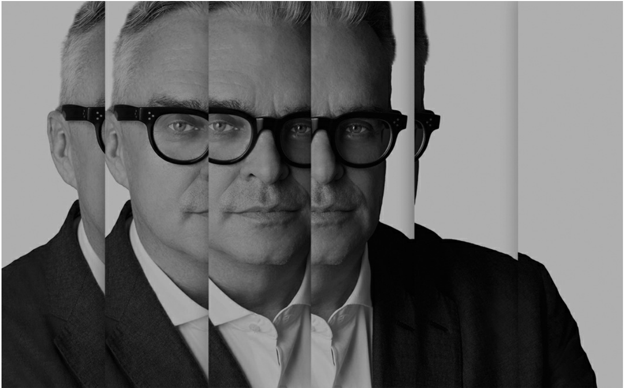
Brian Collins @ DK2024

Business Week opisao ga je kao dizajnersko svjetsko čudo – on je prvi grafički dizajner pozvan da govori na Svjetskom ekonomskom forumu u Davosu i jedan od samo pet nositelja titule American Master of Design, koji, povezujući kreativnost i biznis, stvara jedinstvena iskustva brendova koje strateški predvodi do njihovih poslovnih ciljeva. Na Dane komunikacija , festival tržišnog komuniciranja koji će se u Rovinju održati od 11. do 14. travnja, stiže Brian Collins !