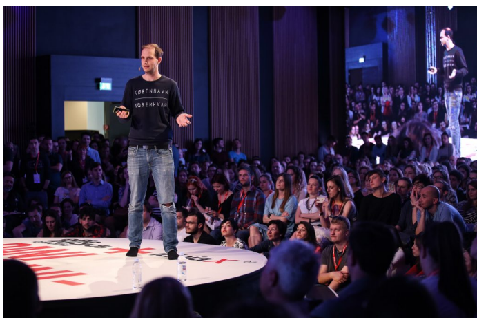
Peter Sunde

Pričajući o samim začecima njegovog digitalnog aktivizma i pokretanja ovog torentskog portala, podijelio je s nama korisnu tajnu koji je naučio na teži način, tijekom boravka u zatvoru. A to je, ako pokušavate napraviti nešto što drugačije, proglasite to religijom i morat će se poštivati! Na krilima ideje kolaborativnog sudjelovanja u digitalnom svijetu te voljom za suprotstavljanjem nametnutom mainstreamu, Sunde je pokrenuo “religiju” Kopimism . Kopimisti vjeruju u “kopyacting”, bezuvjetno dijeljenje digitalnog sadržaja.