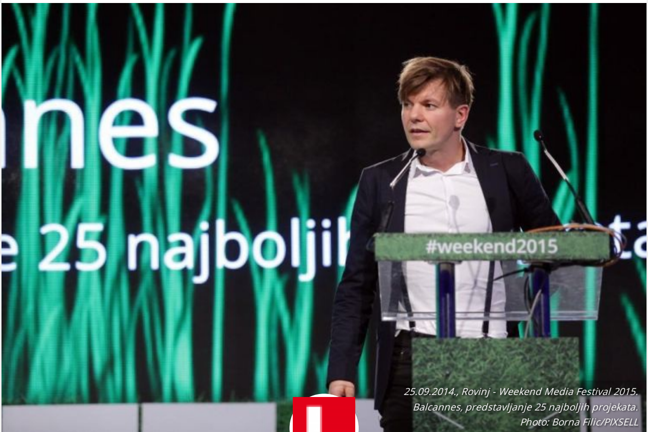
25.09.2014., Rovinj - Weekend Media Festival 2015. BalCannes, predstavljanje 25 najboljih projekata.