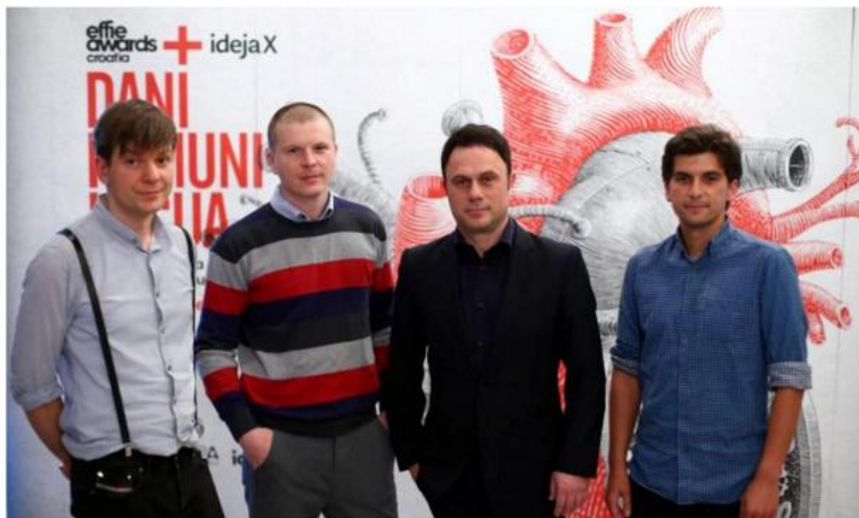
Autor: Danas.hr 15:19 10.02.2016