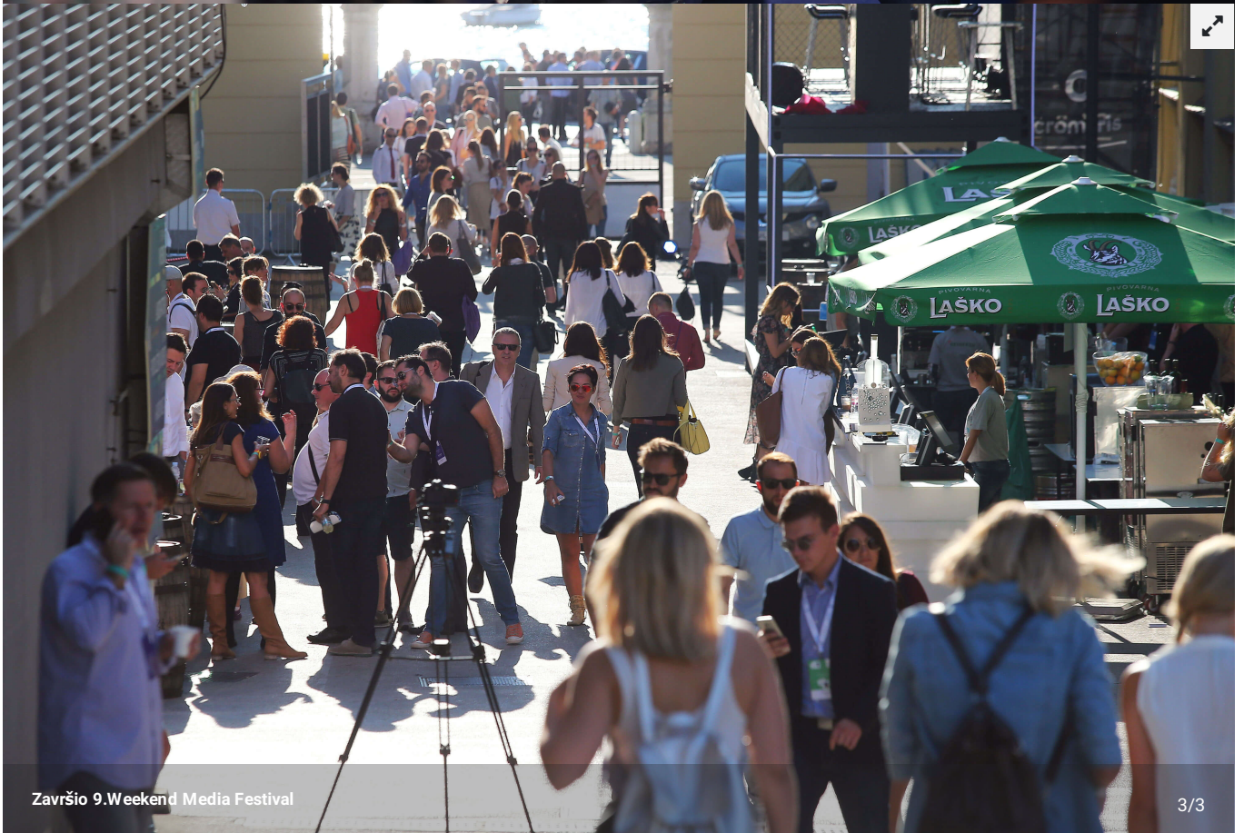
Završio 9.Weekend Media Festival