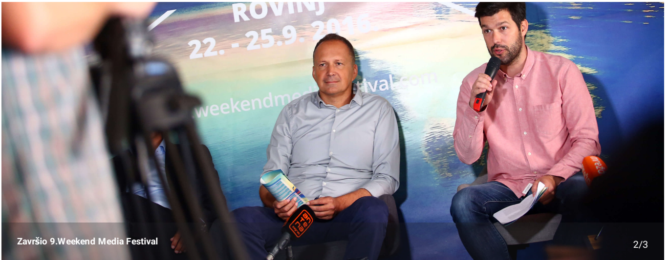
Završio 9.Weekend Media Festival