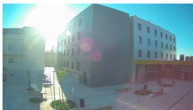
Pula: Gradilište Studentski dom