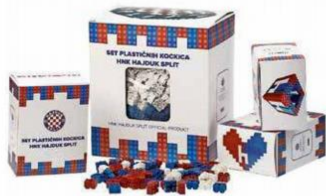
Nagrađeni Hajdukov proizvod