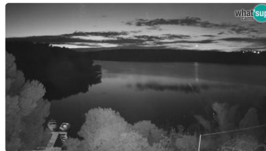
Pula: Banjole bay