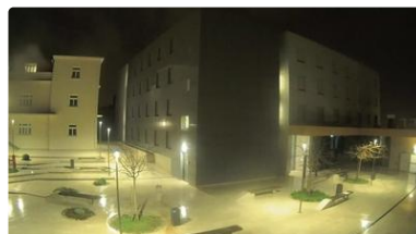
Pula: Gradilište Studentski dom