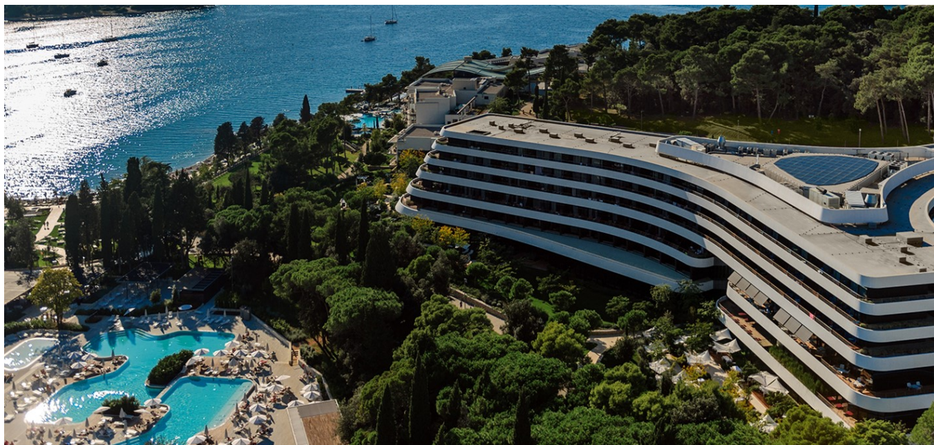
Hotel Lone u Rovinju, gdje se održavaju Dani komunikacija

Nepredvidivo, neuobičajeno i izvan okvira – ali uvijek neupitno kvalitetno, novo izdanje ovog nikad dosadnog festivala kreativnosti i komunikacija otvorilo je prijave, a organizatori i ovom prilikom planiraju iznenađenja i posebne pogodnosti za studente!