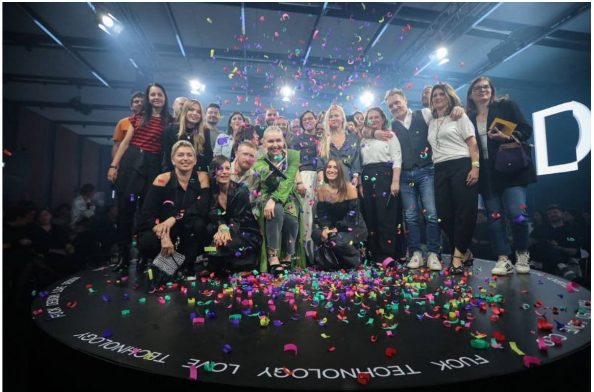
12.04.2024. Rovinj, Drugi dan Dana komunikacija 2024. Dodjela nagrada IdejaX i Young Lions 2024

Skupina Best of Packaging nagradila je broncom sljedeće projekte: Bite Art i Dig studio s projektom BITE ART za MSU u kategoriji Mala naklada; Kraš prehrambena industrija i Bruketa&Žinić&Grey za projekt Ki-Ki redizajn pakiranja voćne karamele u kategoriji Velika naklada.