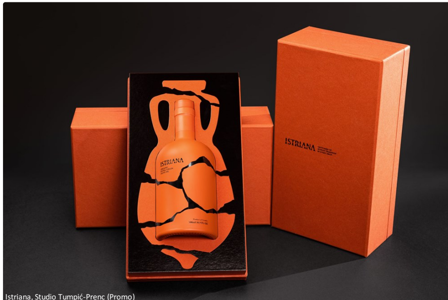
Istriana