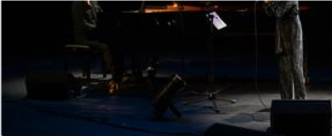
ROVINJ SPRING JAZZ Festival jazza ovaj tjedan u Rovinj dovodi velika imena